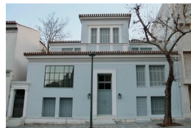
Maison classique -Aéropagitou

Qui n'a pas connu Athènes, ville polluée, poussiéreuse où la circulation était un cauchemar ! C'était les années 1980 – 1990 lorsque le parc automobile était très vieillissant, lorsque le gouvernement avait instauré la circulation alternée avec les numéros pairs et impairs et l'interdiction de rouler au diesel.