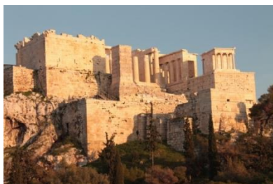
Le rocher de l'Acropole